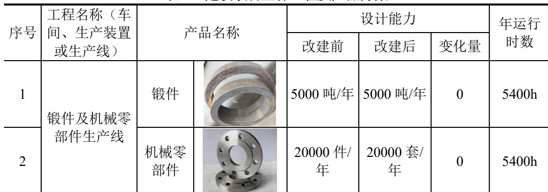
表 2-2 建设项目主体工程及产品方案