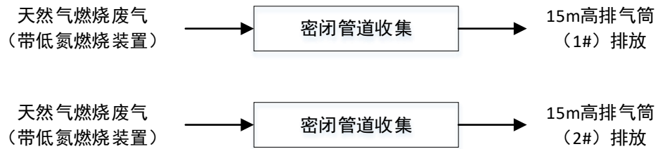
图 4-1 本项目废气处理工艺流程图

本项目 2 台气炉均采用低氮燃烧器，天然气燃烧废气由密闭管道收集，通过 15m 高排气筒（1#）和排气筒（2#）达标排放。